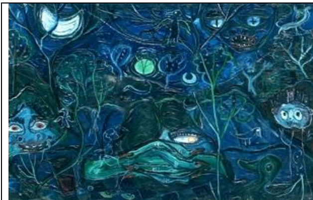
SAVREMENA GALERIJA ZRENJANIN_Igor Vasiljev, Delirijum, 1953