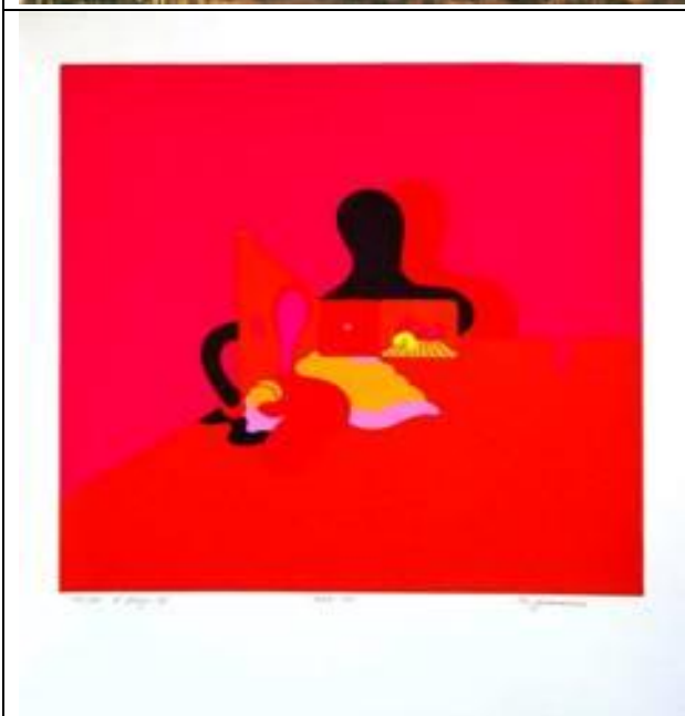
MSUV_Apolonio Zvest_Igre 8_1971_serigrafija