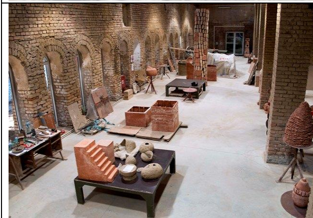
TERRA_Internacionalni simpozijum skulpture TERRA