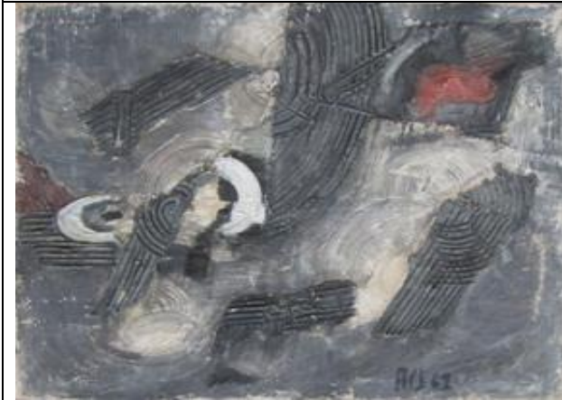
Moderna galerija_Likovni susret Subotica_Jozef Ac_Egzaktno kretanje_1961