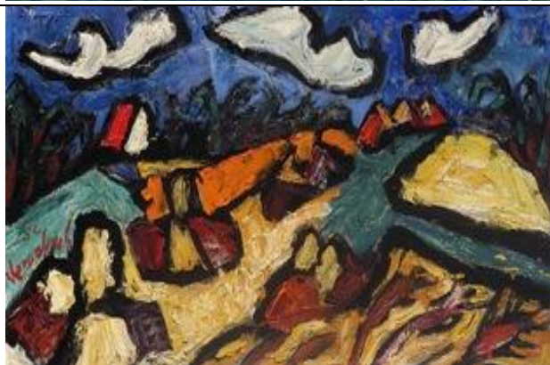
SAVREMENA GALERIJA ZRENJANIN_Milan Konjović, Žito, 1956