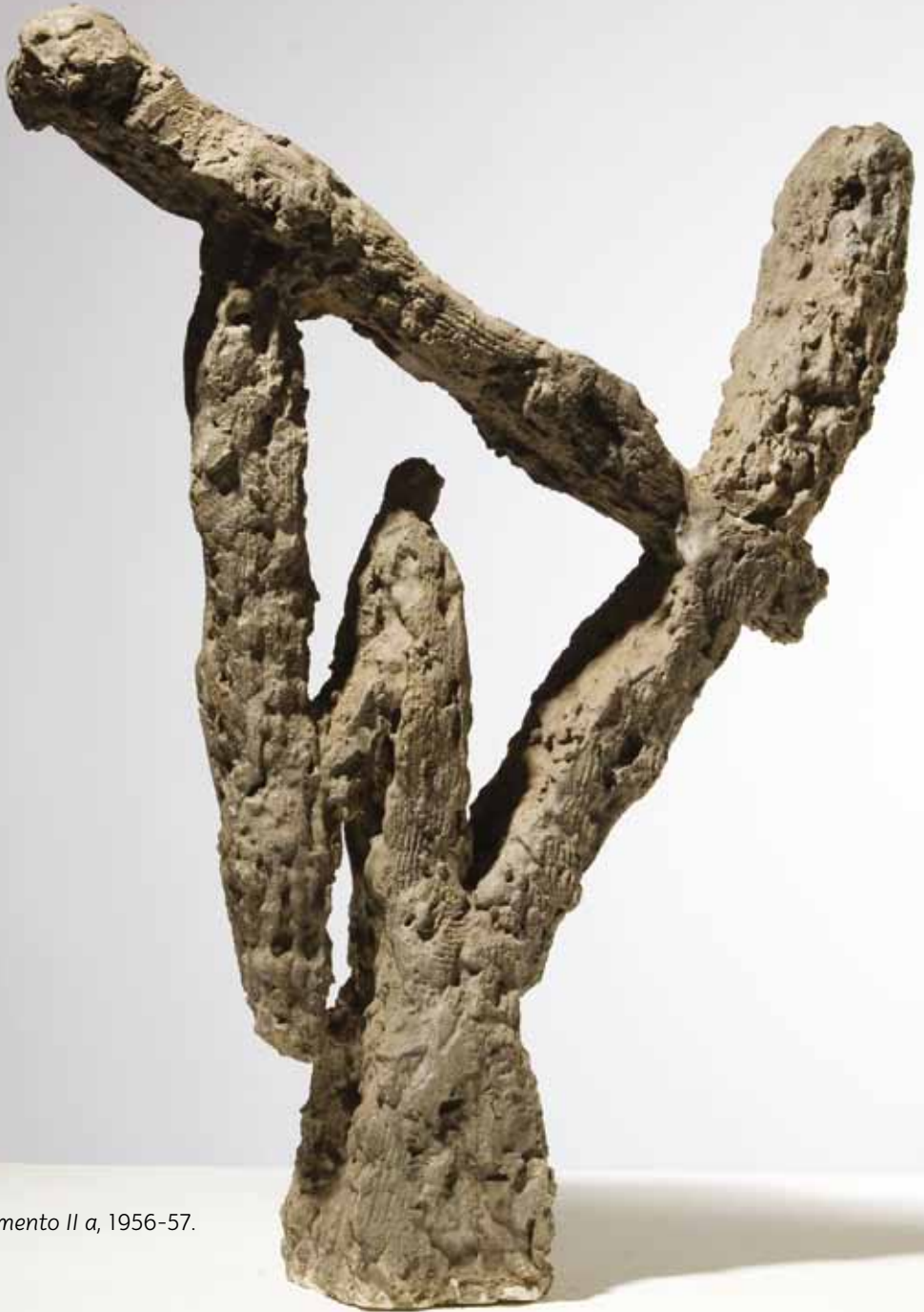
Memento II a , 1956-57.