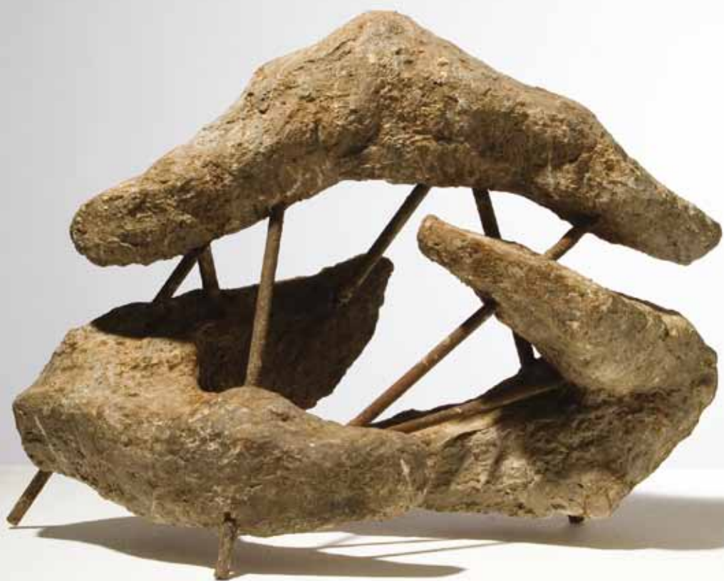
Tri elementa I , 1955-56.