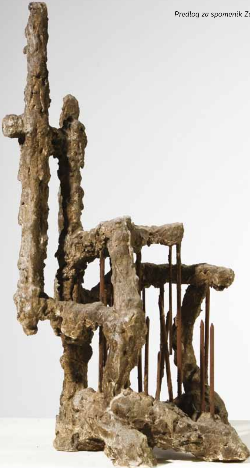
Predlog za spomenik Zenica II a, 1961.