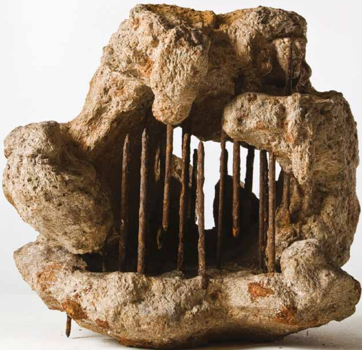
Prostor u staništu I a, 1966-74.