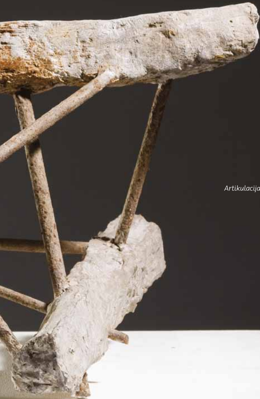
Artikulacija prostora II, 1956-57.